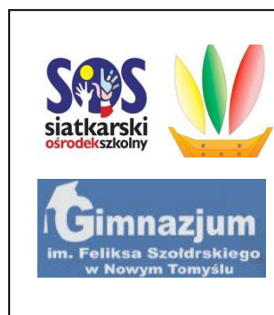
S. O. S NOWY TOMYŚL