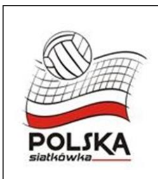
PZPS W WARSZAWIE