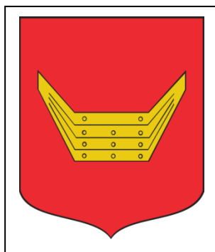
GMINA NOWY TOMYŚL